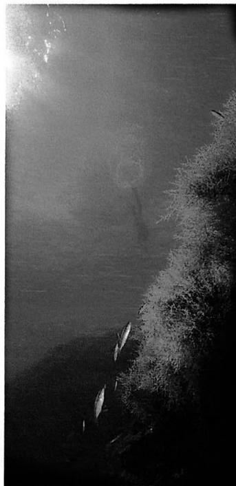
Kilpailusvyvyys oli 15 metristä 35 metriin.