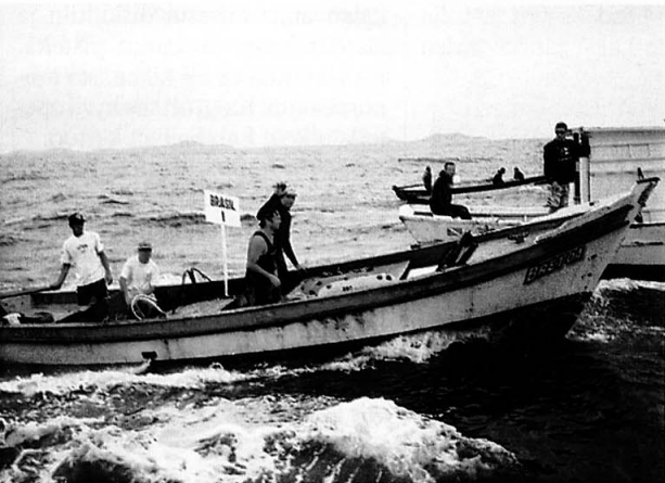
Brasilian ykköstiimi tuli kisassa kakkoseksi. Veneessä sukelluskalastajan apumies, kuski ja kuskin apumies.